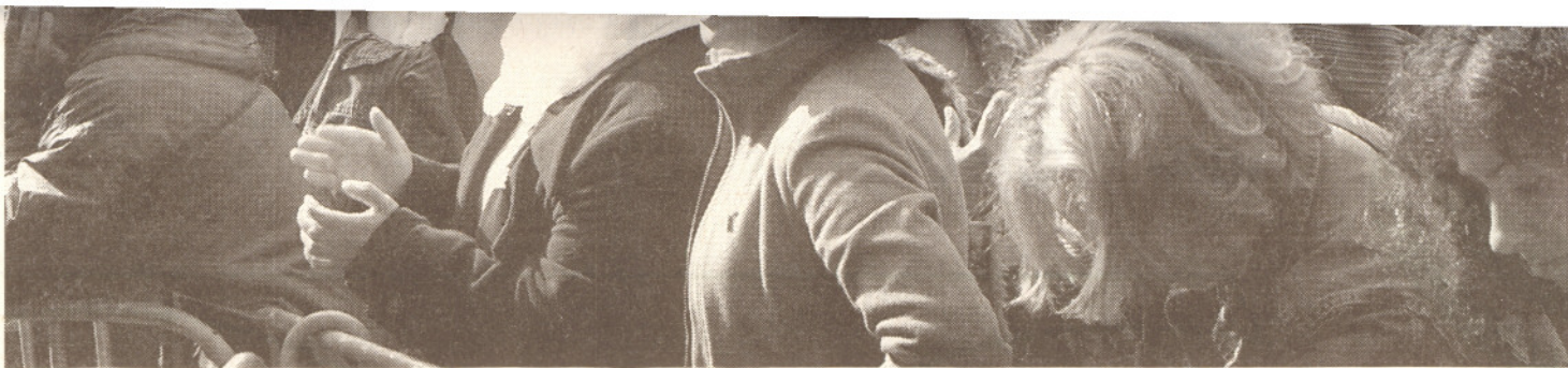
Geen ruimte is zo veilig als een openbare ruimte vol mensen die het naar hun zin hebben.