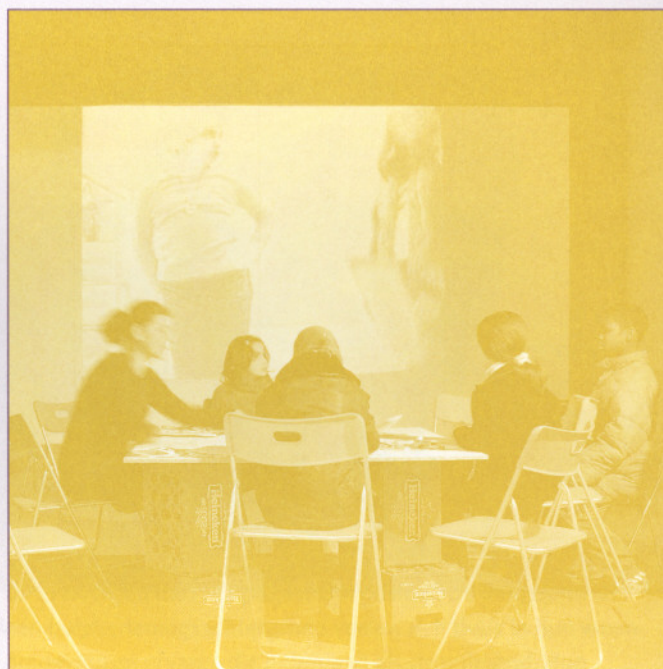
Meer aandacht voor kunst in de openbare ruimte . . .